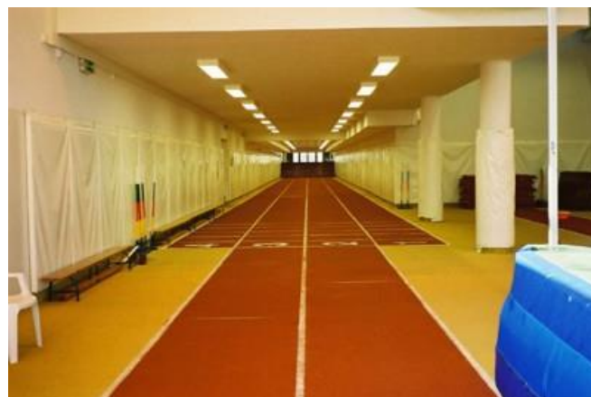
Widok wnętrza tunelu lekkoatletycznego

Niejako dopełnieniem dla głównego stadionu lekkoatletycznego jest, dostępny bezpośrednio z jego płyty, tunel lekkoatletyczny o powierzchni 805 m 2 . W budynku dla zawodników dostępne są; czterotorowa bieżnia prosta o długości 60 m z wybiegiem (kryta nawierzchnią Mondo), skocznia w dal, skocznia wwyż, skocznia do trójskoku, skocznia do skoku o tyczce . Obiekt dopełniają dwa dedykowane dla niego zespoły sanitarno-szatniowe.