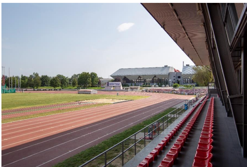
Widok z widowni stadionu głównego w stronę przejścia do tunelu lekkoatletycznego