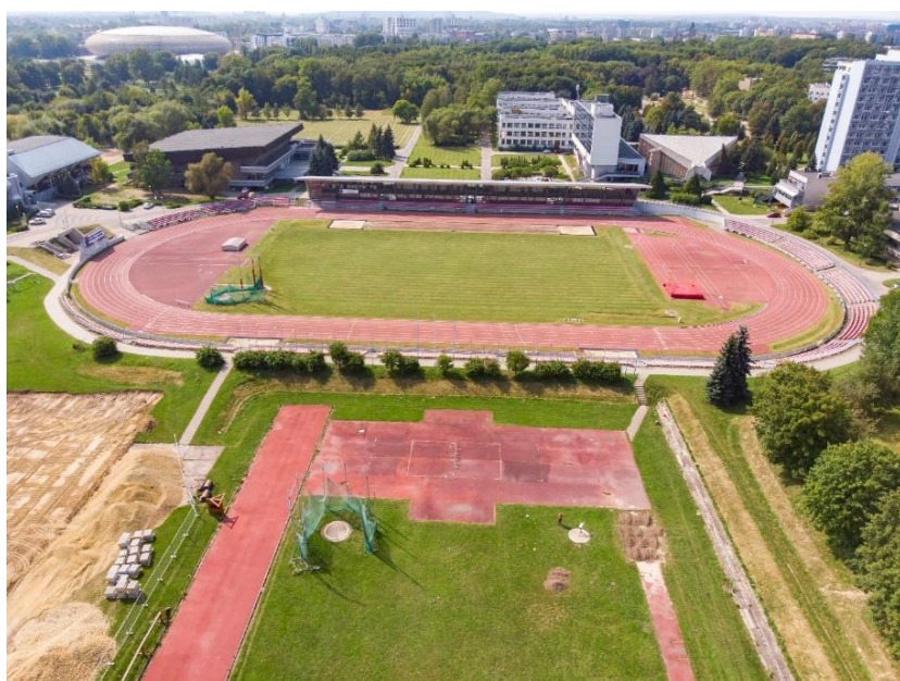
Widok z lotu ptaka na stadion główny, stadion treningowy oraz Pawilon Obsługi Stadionu

Stadion posiada: ośmiotorową bieżnię o sztucznej nawierzchni typu Mondo, dwie dwustronne skocznie do skoku w dal i do trójskoku, dwa przeciwległe rozbiegi do rzutu oszczepem, rów z wodą usytuowany wewnątrz bieżni, dwa rozbiegi do skoku o tycce. Ostatnia modernizacja stadionu wykonana została w 2009 r., również wtedy zakończono budowę Pawilonu Obsługi Stadionu, w którym zlokalizowane są zespoły sanitarno-szatniowe, pomieszczenia sędziowskie i gabinety antydopingowe.