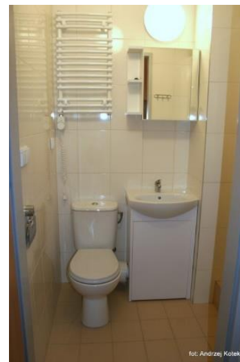
Widok typowego pokoju studenckiego